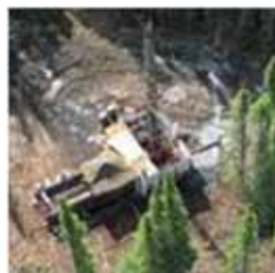
Mina de Hierro y Concentrador

El mineral es triturado, molido y separado por un separador magnético para producir un concentrado de >66% Fe y 2 – 3% Mn