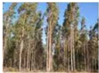
Plantaciones de Eucaliptos

El riesgo en tecnología involucrado en el proceso de producción de arrabio de GLA es insignificante dado que está basado en tecnologías ya existentes.