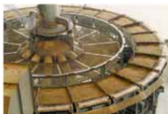
Planta de Sinterización

El mineral es triturado, molido y separado por un separador magnético para producir un concentrado de >66% Fe y 2 – 3% Mn