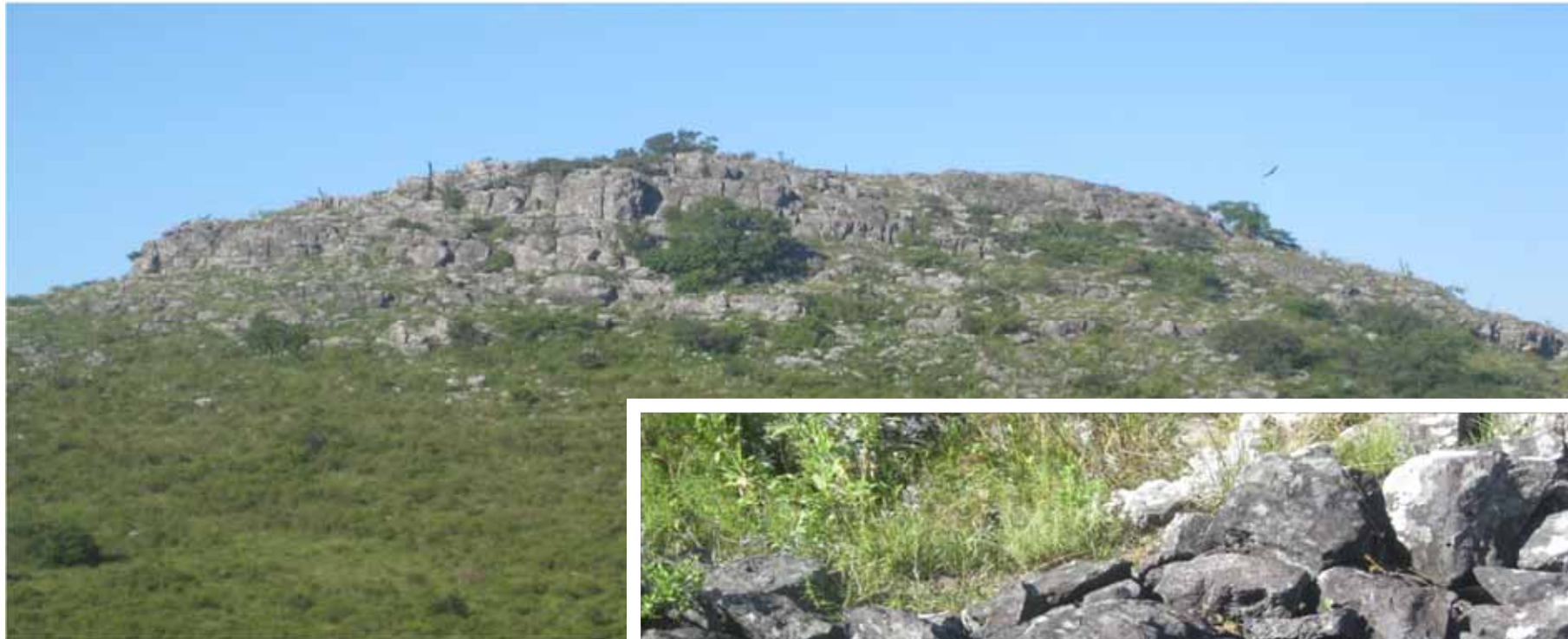
Afloramiento Típico de Magnetita