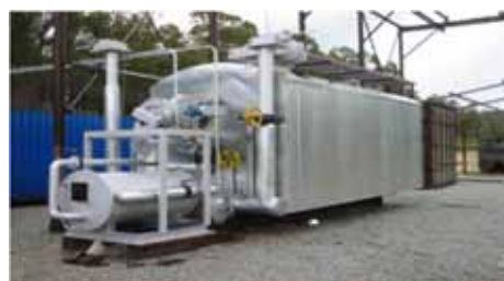
Planta de Carbón DPC

La materia prima preferentemente será la de troncos con diámetros menores producida por el adelgazamiento de plantaciones cercanas