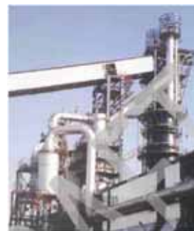
Alto Horno de Fundición

Materia prima principal de sinter y carbón agregada al horno de cantidades menores de fluxes